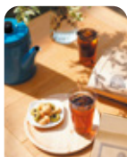
川原製粉所 東京麦茶 ティーバッグ