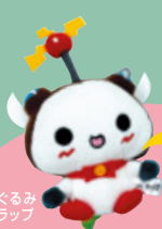
めいくるみ ストラップ

区の花は「ツツジ」 種類がたくさんあっていい香りねり! 区の木は「コブシ」という木で 春には白い花が咲くねり!