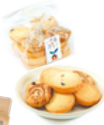
つくりっこの家 クッキー