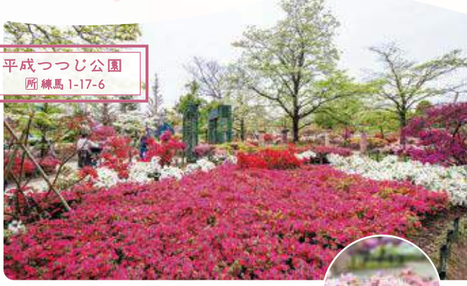
23 平成つつじ公園 所 練馬 1-17-6

約600品種・約10,000株のツツジが栽培されて います。1994年の開園記念で「練馬の鏡」と命名 された久留米ツツジが植えられました。(右画像)