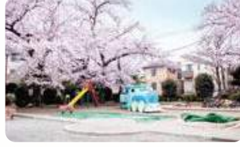
27 徳殿公園 所 豊玉南 1-16-1