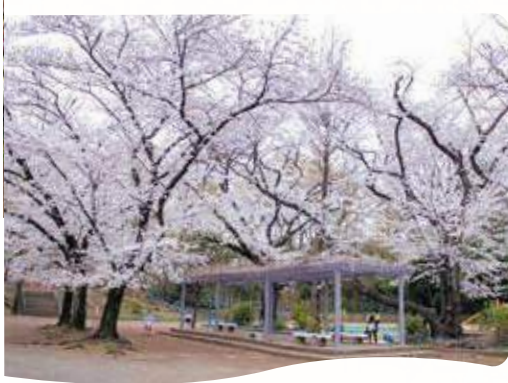
31 高稲荷公園の桜 所 桜台6-40