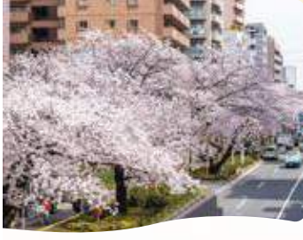
26 中村西歩道橋 所 中村北 4-11

氷川神社の力石 かつてカくらべに使われ ていたという河原石が 8つ置かれている。