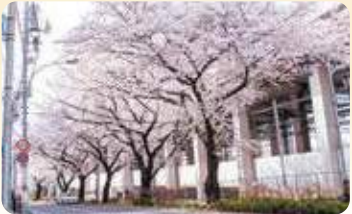
22 千川通り 所 桜台 4