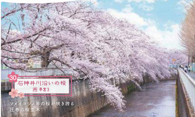
30 石神井川沿いの桜 所 早宮3