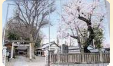
21 江古田浅間神社 所 小竹町 1-59

大きなケヤキと桜の木が境内にある。 重要有形民俗文化財「江古田の 富士塚」が保存されています