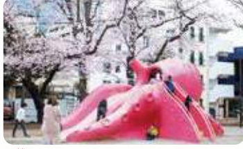
25 豊玉公園(通称:タコ公園) 所 豊玉北 6-8-3

大きなケヤキと桜の木が境内にある。 重要有形民俗文化財「江古田の 富士塚」が保存されています