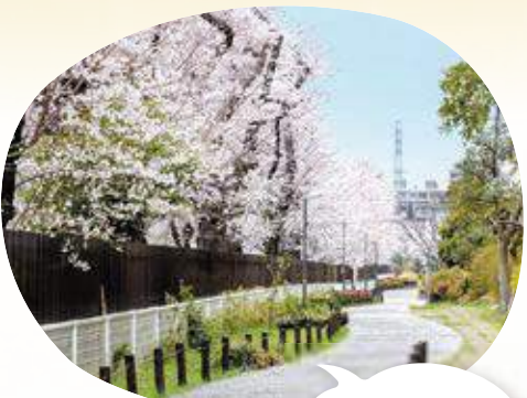
28 田柄川緑道 所 北町2~3