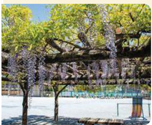
32 練馬東小学校 フジ棚 所 春日町1-30-11