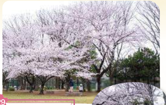
29 城北中央公園 所 水川台1